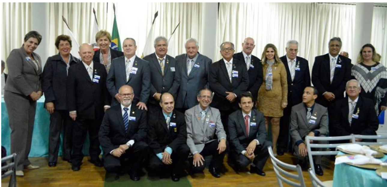
Equipe Distrital do Governador João Bosco Beze

A Posse do Governador João Bosco Ribeiro Beze ocorreu na cidade de Oliveira, onde ele e sua esposa Vani Costa Beze tiveram a oportunidade de recepcionar os convidados com um belíssimo Jantar de confraternização.