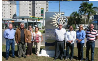
Pouso Alegre das Gerais E Pouso Alegre Sul