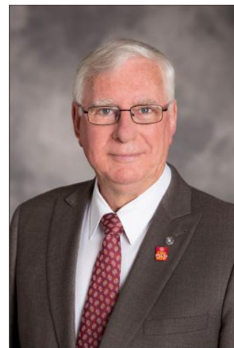
Ian Riseley – Presidente RI 17/18

A erradicação da pólio é o maior serviço sustentável. Trata-se de