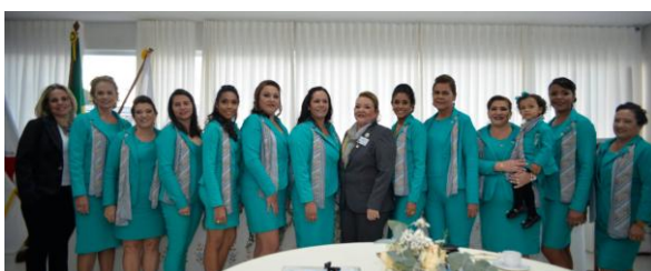
Linda Equipe, linda organização, agora mãos a obra.