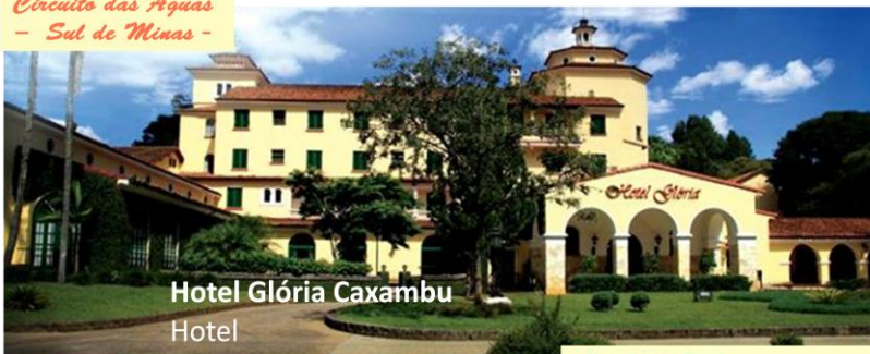
Hotel Glória Caxambu Hotel

Hotel Glória Caxambu Circuito das Águas - Sul de Minas -